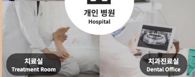
치료실 Treatment Room