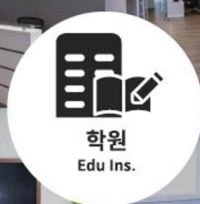
학원 Edu Ins.

The application supports the operation of up to five devices. 'Deepscent Lounge' can be located in each space of the house and it is easy to use in small businesses such as offices, academies, and private hospitals. With four capsules of a 'Deepscent Lounge' can fill a space of about 20 ~ 26 m 2 with fragrance.