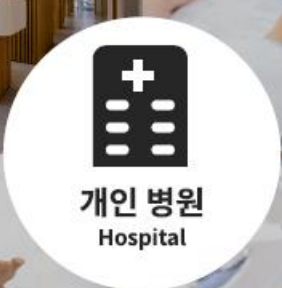
개인 병원 Hospital