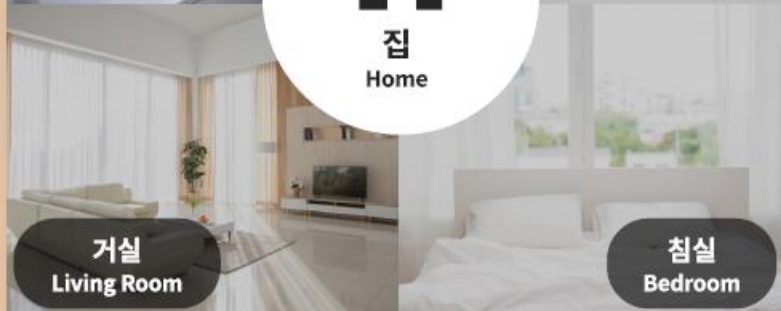
거실 Living Room